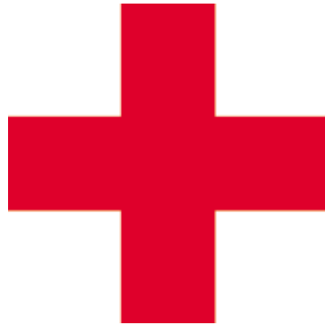
รูปที่ 1 เครื่องหมายกาชาด (กากบาทแดง, red cross)

สภาเสี้ยววงเดือนแดงในประเทศต่างๆ แล้ว ยังได้กำหนดเครื่องหมายกากบาทแดง (red cross) บนพื้นขาว (รูปที่ 1) เพื่อเป็นสัญลักษณ์สำหรับหน่วยงานบรรเทาทุกข์นั้น