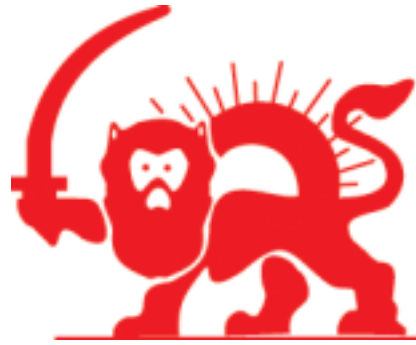
รูปที่ 3 เครื่องหมายสิงโตและดวงอาทิตย์แดง (red lion and sun)

กว่านี้จึงจำกัดให้เฉพาะ 3 ประเทศ ซึ่งได้ใช้สัญลักษณ์นี้อยู่แล้ว ดังนั้นสัญลักษณ์ทั้ง 3 นี้จึงมีสถานะเท่าเทียมกันภายใต้อนุสัญญาเจนีวา ปัจจุบัน มี 151 ประเทศ ที่ใช้เครื่องหมายกาชาดแดง และ 32 ประเทศ ใช้เสี้ยววงเดือนแดง