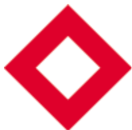
รูปที่ 5 ผลึกแดง (red crystal)