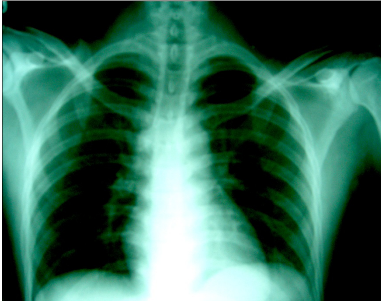
ผู้ป่วยรายที่ 1

X-ray ในผู้ป่วยรายที่ 1 และ 2 ที่เห็นจะพบ fractures of clavical ด้านไหน