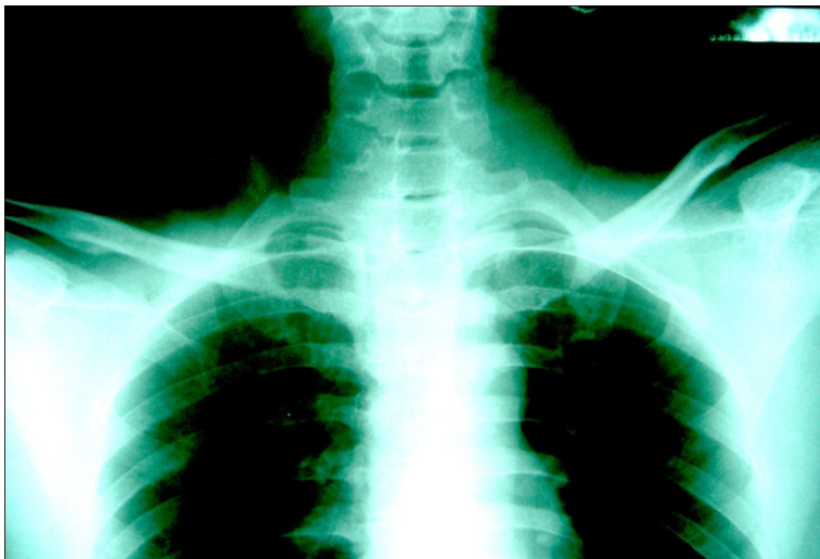
ผู้ป่วยรายที่ 2