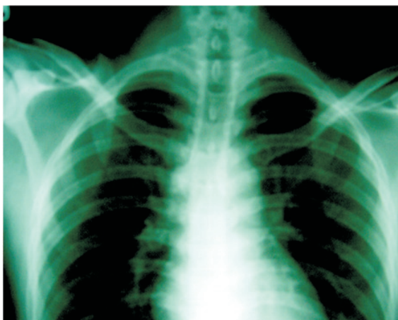
ผู้ป่วยรายที่ 1 Fracture of left clavicle