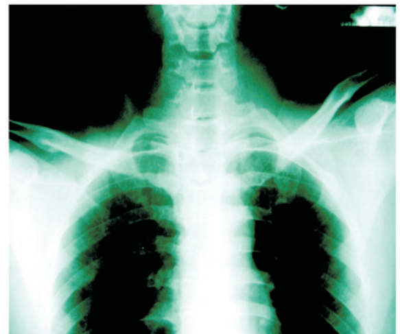
ผู้ป่วยรายที่ 2 Fracture of right clavicle