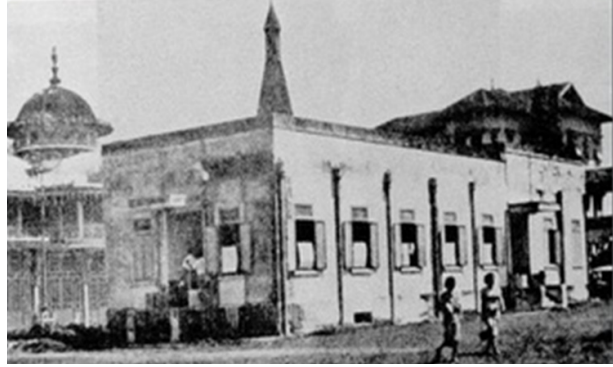
กองเสนารักษ์ จังหวัดทหารบกกรุงเทพฯ ณ วังพญาไท